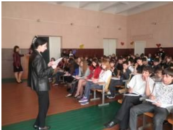
Тренінг «Геть паління! Ми—здорове покоління!»