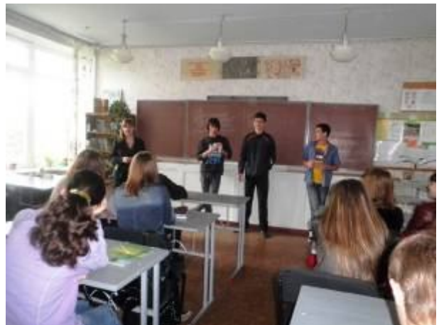
Тренінг «Крок у безодню!»